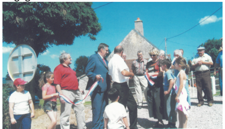
Inauguration de l'Agorespace.

La municipalité tient à lui rendre un dernier hommage, pour avoir consacré une grande partie de sa vie au village et souhaite le remercier une nouvelle fois pour cet engagement.